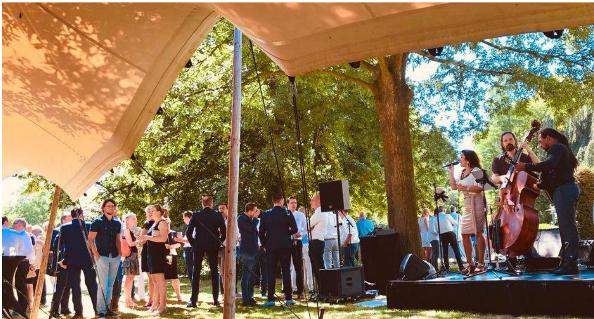
In de tuin van het Marechausseemuseum werden in diverse weekends zomerconcerten gegeven.